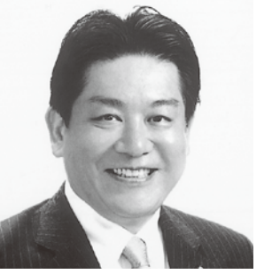
長野県選挙区 民主党公認・参議院議員候補者 羽田雄一郎 (45歳)