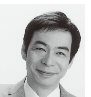
幸福実現党 あじおか 幸福実現党