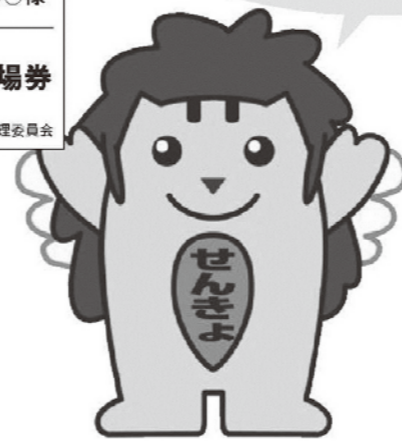
※投票入場券の様子は市町村によって異なります。