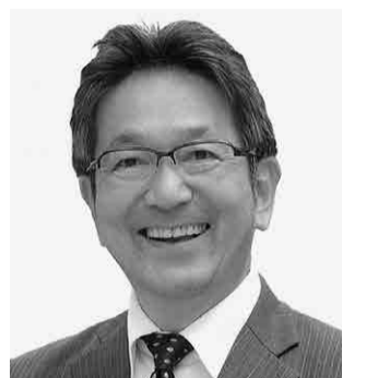
民進党公認 参議院議員候補者