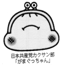
日本共産党の「チェンジ」がまぐつちゃん

アベノミクスで貧困と格差はますます拡大し、貯蓄ゼロが全世帯の35%に。所得の低い人に重い消費税は、延期でなく断念すべきです。