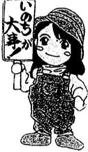
1952年平川町生まれ 清水小、国分中、帖佐中、加治木高校、純心短大卒