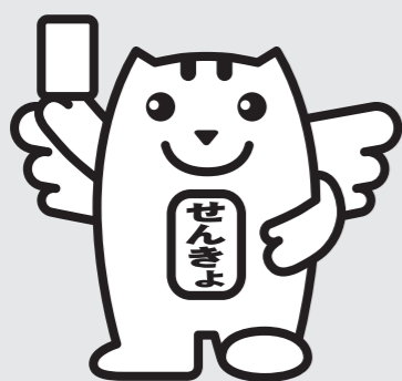
「選挙のめいすいくん」